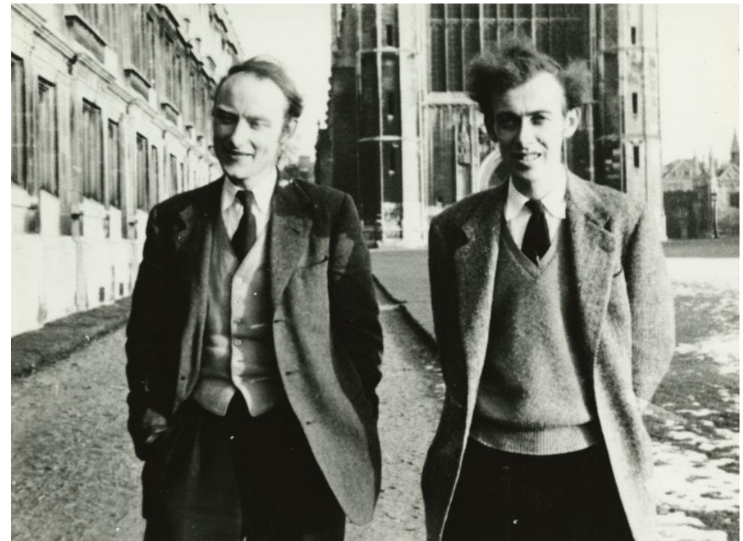
Watson & Crick

On this spot, on February 28, 1953, Francis Crick and James Watson made the first public announcement of the discovery of DNA with the words "We have discovered the secret of life". Throughout their early partnership Watson & Crick dined in this room on six days every week