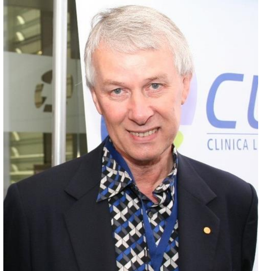
Peter Agre (Nobel Química 2013)